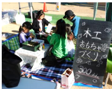
体験広場 おもちゃづくり