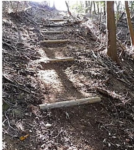
急斜面のビフォーアフター

山に登ってくださいとお勧めすることができないのが辛いところです。クマ騒動が収束したら、ぜひ角尾山に登ってください。急斜面に階段が設置されて登りやすくなっています。