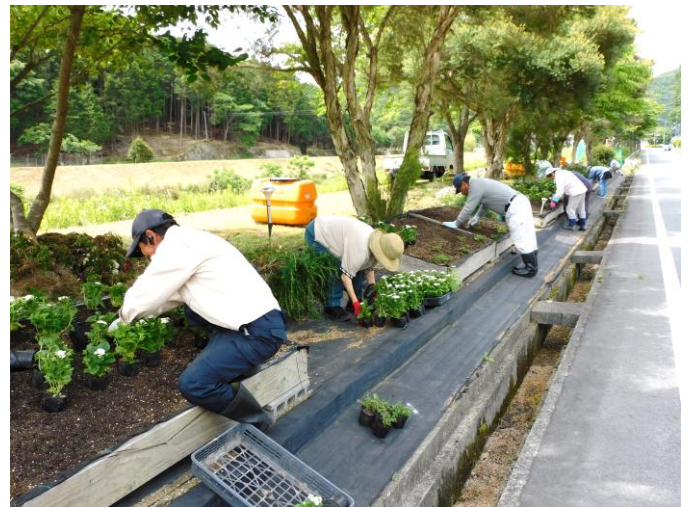
合山町の花壇に花苗を定植