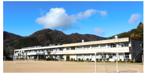
みんなの思い出がつまった芳田小学校

この「統合」について、芳田小学校が廃校になり、重春小学校に吸収されるというイメージを持たれている方が多いのではないのでしょうか。教育委員会の提示した資料によると、統合には新設統合と校区再編(吸収統合)の2つの方法があるとのこと。したがって、開校準備委員会はどの方法を選択するかということから協議していくことになります。校区再編とちがって、新設統合の場合は校名、校歌、校章、校旗等も協議する必要があります。また、通学方法やPTA組織の統合も検討事項になります。