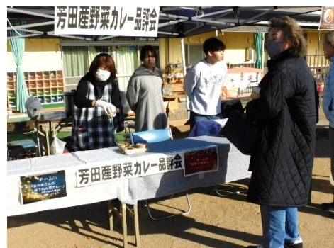
芳田産野菜カレーのコーナー