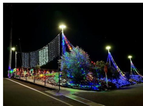
キッズイルミネーション