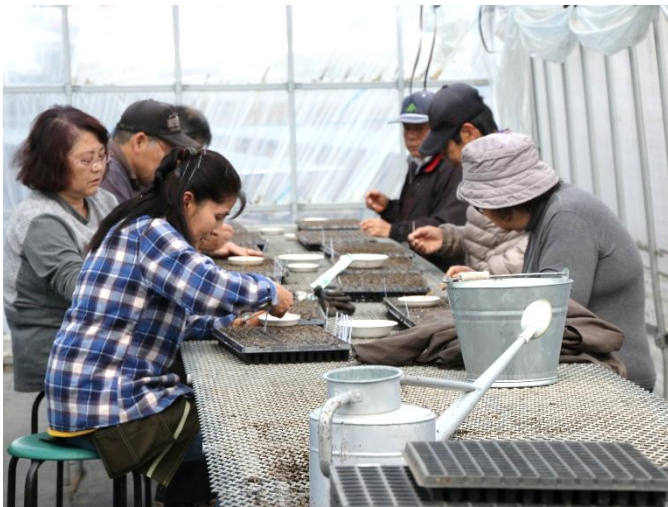
細かな作業が必要な種まき

そんな夢うさぎが今年度いっぱい活動を終えられます。もっと続けてほしかったのですが、無理もいえません。紙面を借りて夢うさぎのみなさんにお礼申し上げます。芳田地区に大きく貢献していただいたこと、本当にありがとうございました。