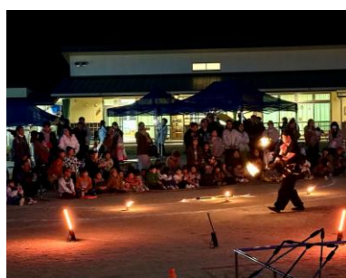
向火葵によるファイヤーイベント