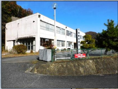
トイレ利用可(日曜日は休館)