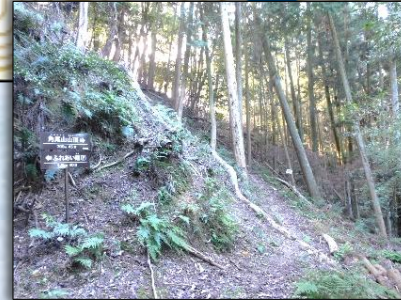
林道終わり 登山道へ