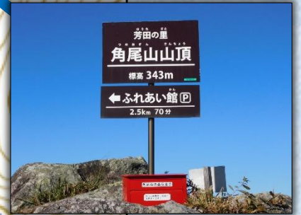
登山記念に記帳を