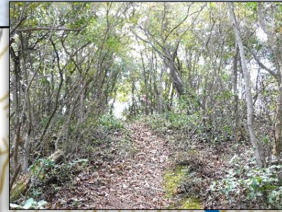
尾根伝いに 岩場もあり