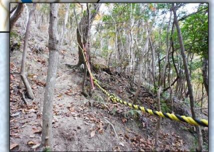
新道は急斜面 ロープを使って