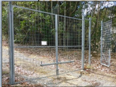
ゲート通過後 閉め忘れずに